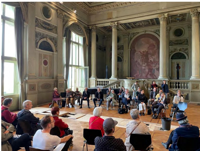
Un auditoire captivé composé de membres de la SCR et de l'association de soutien Förderverein Semper Stadthaus Winterthur