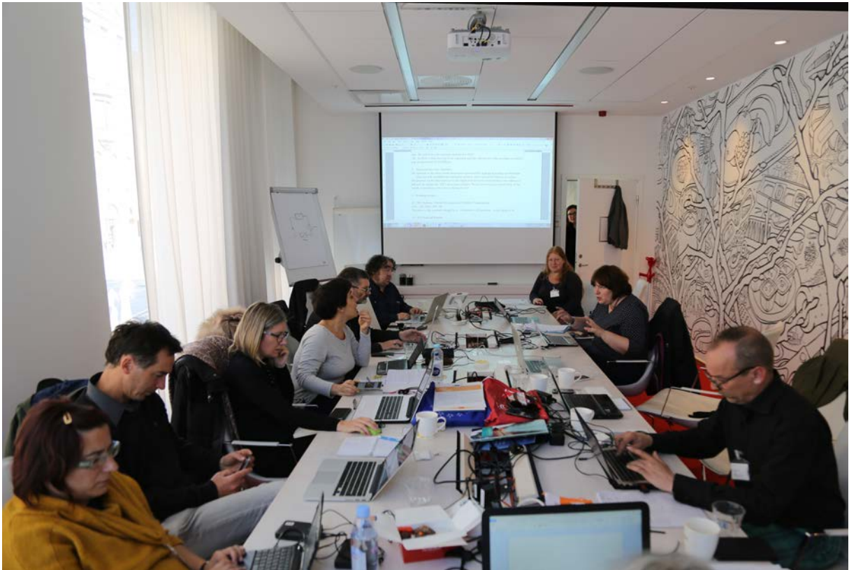
E.C.C.O.: séance du Comité lors de la préparation de l'Assemblée générale à Stockholm.